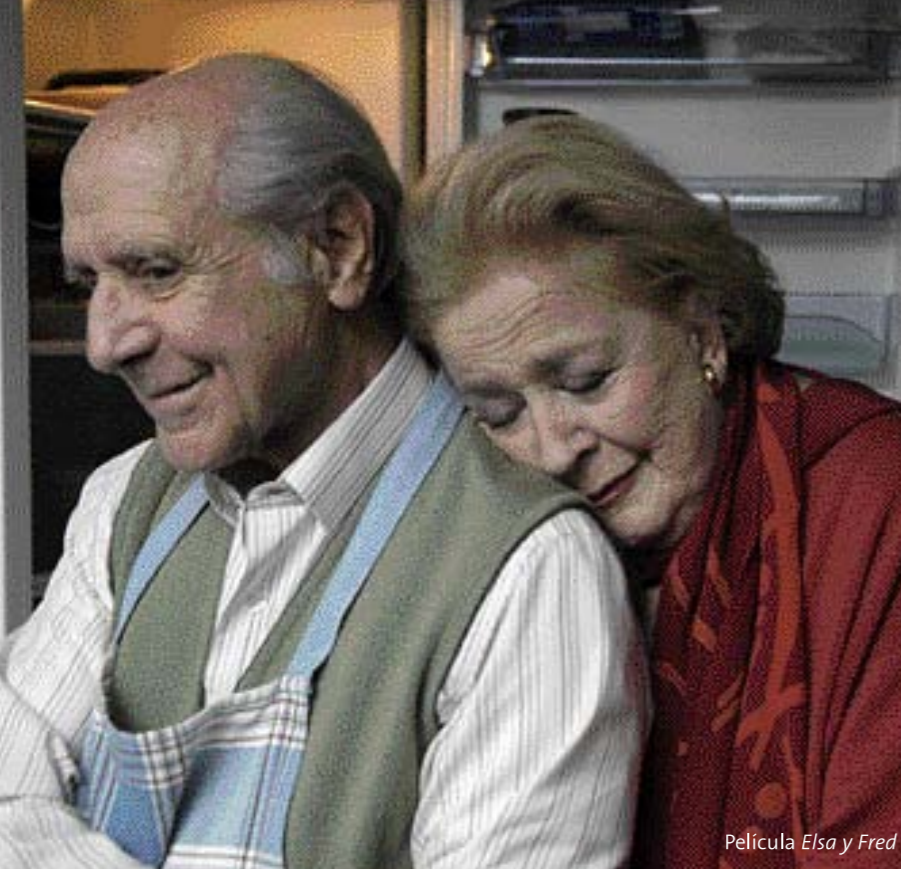
Película Elsa y Fred

–¿Cómo se da la elección de la pareja? ¿Por qué preferimos una frente a otra?