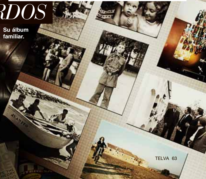
Su álbum familiar.