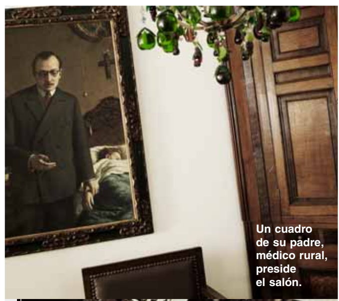
Un cuadro de su padre, médico rural, preside el salón.