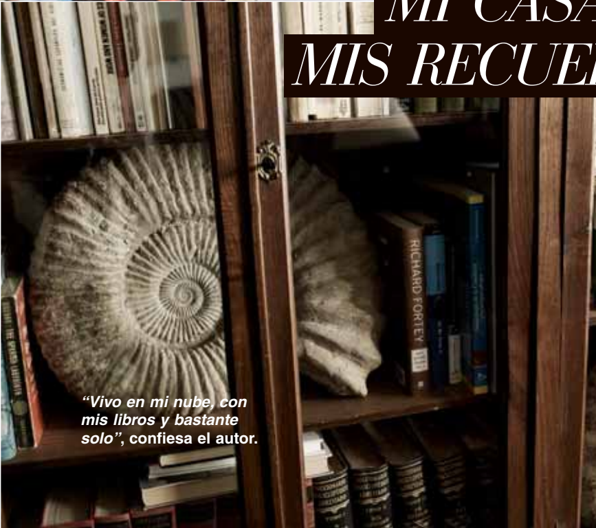
"Vivo en mi nube, con mis libros y bastante solo", confiesa el autor.